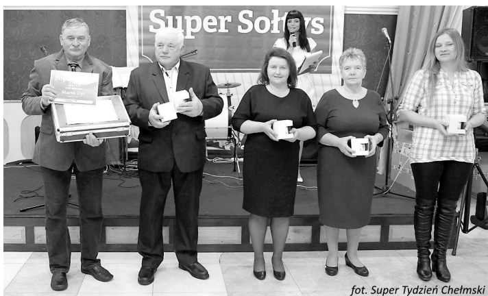
fol. Super Tydzień Chełmski