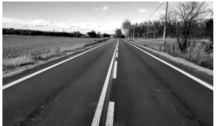
Droga Nowiny – Rudka (1823L)

4. Droga Karolinów – Gotówka - 2,9 km (wykonana została przebudowa drogi o szerokości 5,5m wraz z jednostronnym poboczem asfaltowym w centrum miejscowości).