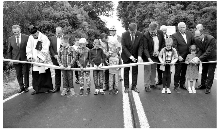
Otwarcie drogi Sawin – Ruda (1821L)